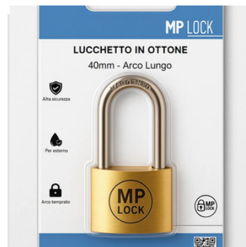
Fornito in blister