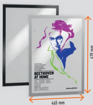
A2 (42,0×59,4 cm) # 5053