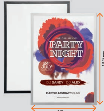
70×100 cm # 5056