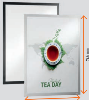
50×70 cm # 5054