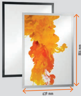
A1 (59,4×84,1 cm) # 5055