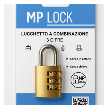
Fornito in blister