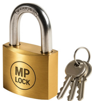
3 Chiavi duplicabili