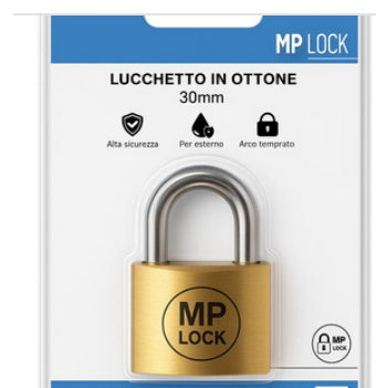
Fornito in blister